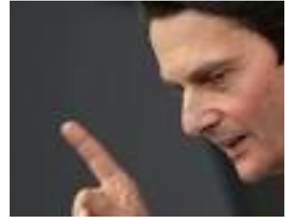
Dr. Rolf Mützenich, Außenpolitischer Sprecher der SPD-Bundestagsfraktion

Ausgehend von der Revolution in Tunesien im Dezember 2010 verbreiteten sich die Unruhen und Proteste in etlichen Staaten im Nahen Osten und in Nordafrika gegen die dort autoritär herrschenden Regime und die politischen und sozialen Strukturen dieser Länder. Die engen politischen und wirtschaftlichen Verbindungen zu einigen dieser Staaten führen in den EU-Ländern teilweise zu Kontroversen. Welche Rolle Deutschland einnimmt und welchen Einfluss wir nehmen können hat Rolf Mützenich an diesen Abend mit uns diskutiert.