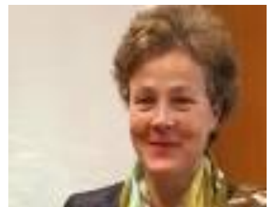
Dr. Agnes Klein Dezernentin für Bildung, Jugend und Sport

Die Umsetzung stellt eine große Herausforderung dar, da es nicht nur um die inhaltliche, sondern auch um die bau- und finanztechnische Umsetzung geht und daher intelligente Lösungen angestrebt werden, wenn es keine Grundstücke und Immobilien gibt (z.B. durch Erweiterungsbauten, da wo möglich und Erweiterung der Zügigkeit in Gymnasien und Gesamtschulen). Der Schul- und Weiterbildungsausschuss wird diesen Prozess kritisch begleiten.