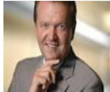
Rondorf, Haus der Familie Reiherstraße 21

An dieser Stelle sei noch mal dem Haus der Familie gedankt, weil wir dort sehr gut unterstützt wurden in Sachen Raumgestaltung und Unterstützung in der Küche durch einen Mitarbeiter des Hauses, so dass wir wie in einer Großfamilie am gedeckten Tisch zusammen sitzen, essen und diskutieren konnten.